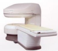
APERTO Lucent Prime Open MRI (MRI装置)

のレベルアップに負けないよう自己研磨に励んでいきたいと思っています。最後に「放射線被ばく」についての簡単な説明をします。